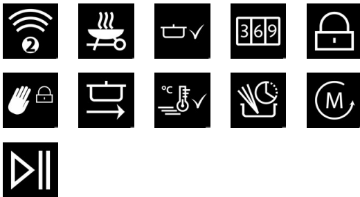
4132_NorCook IH N6326 BK